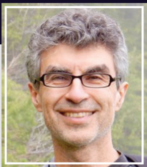
Yoshua Bengio , prix Turing d'informatique Intelligence artificielle et science ouverte